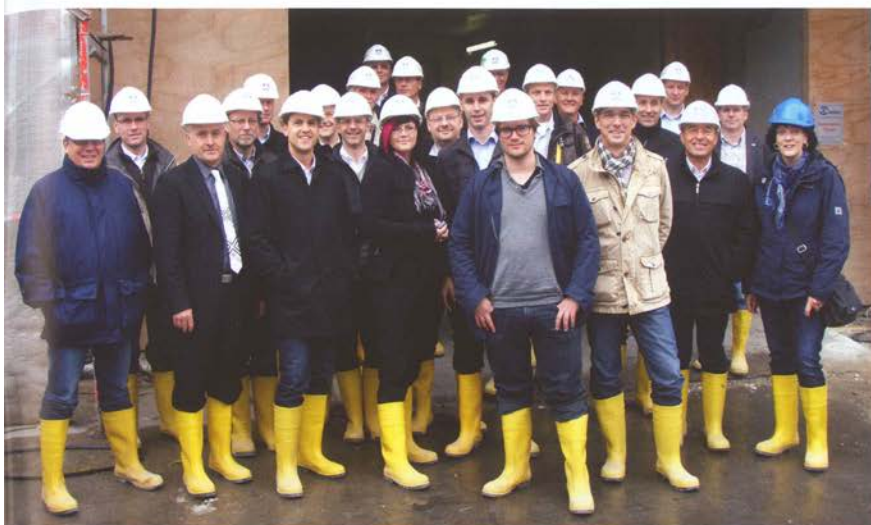
Ein starkes Netzwerk in jeder Hinsicht: Die „DLV-Ladenbautagung“ in Hamburg war ein voller Erfolg.

106 000 Besuchern und 2 038 Ausstellern, war es die größte „Euroshop“ aller Zeiten. Der DLV belegte mit elf Mitgliedsunternehmen erstmals eine Fläche von 750 m 2 und repräsentierte damit den größten Stand in Halle 11. Pünktlich zur Messe erschien im Februar dieses Jahres auch das „DLV-Ladenbau-Magazin“. Es erscheint alle drei Jahre und ergänzt das Medien-Kompen-