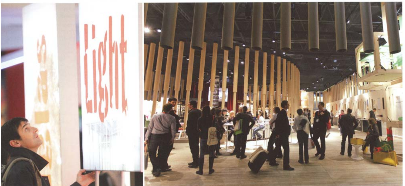
„Licht“ war eines der ganz klar dominierenden Themenbereiche auf der EuroShop in Düsseldorf.

steller belegten alleine eine gesamte Messehalle. Besonders stark im Kommen: moderne LED-Lösungen, die in einer Vielzahl von Varianten in Düsseldorf gezeigt wurden. Ein ganz großer Vorteil der noch jungen Technik ist dabei die Energie-Effizienz. Denn für den Handel immer wichtiger wird das Thema „Nachhaltigkeit“. Die EuroShop hatte deshalb in diesem Jahr durch den „ECO-Park“ und das „ECO-Forum“ eine eigene Plattform rund um „Grüne Lösungen“